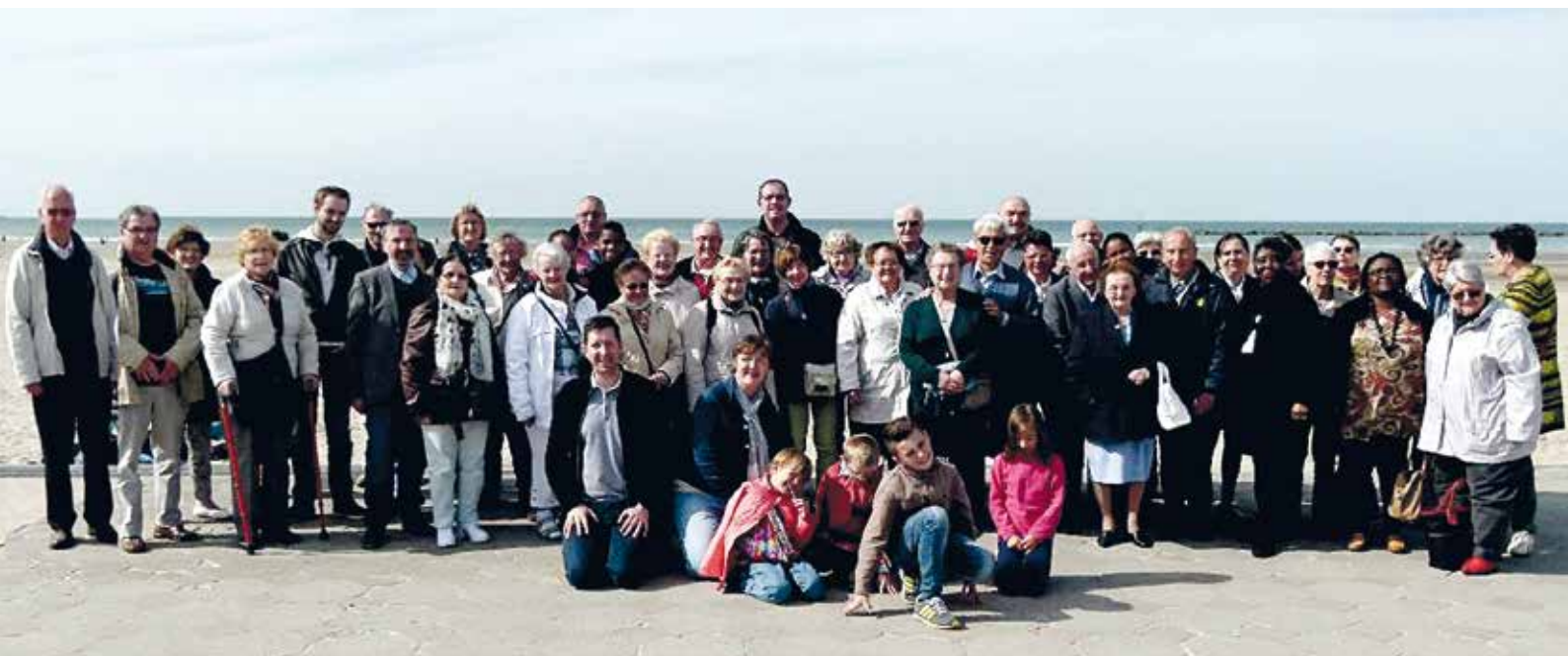
■ Sur la digue de Malo.