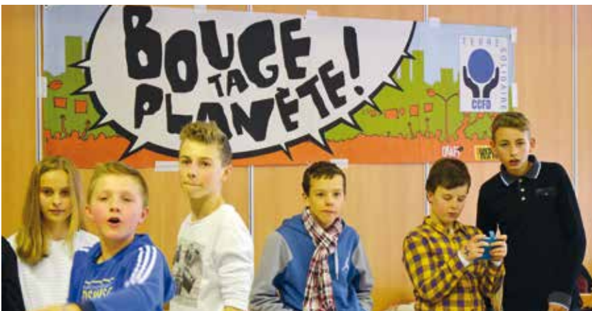
■ Bougeurs de planète.

Une belle journée réussie, fruit d'une préparation portée par une quinzaine de personnes des mouvements de la pastorale des jeunes et du Comité catholique contre la faim et pour le développement (CCFD). Nous avons expérimenté de l'intérieur que vivre l'Église, c'est vivre les différences et dépasser les préjugés.