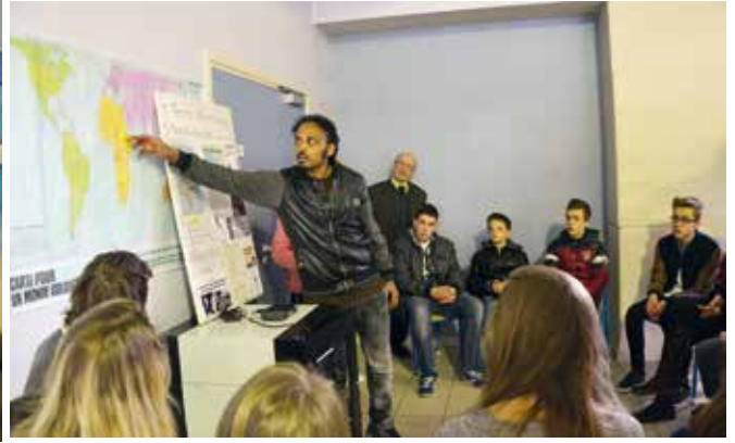
■ Les migrants de l'Érythrée.

Plus de cent trente jeunes colégiens et lycéens du doyenné Haubourdin-Weppes ainsi que parents, amis, accompagnateurs, se sont rassemblés sur ce thème à l'espace Beaupré d'Haubourdin l'après-midi du samedi 28 mars.