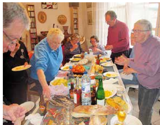
■ En mars 2014, table paroissiale ouverte à Roubaix.

«JE DÉSIRE UNE ÉGLISE PAUVRE POUR LES PAUVRES. ILS ONT BEAUCOUP À NOUS ENSEIGNER» PAPE FRANÇOIS, IN «LA JOIE DE L'ÉVANGILE», N° 198