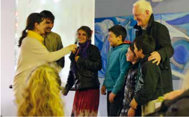
■ Avec le père Arthur.

Vivre ensemble : luttons contre les préjugés et les discriminations... chez nous et dans le monde.