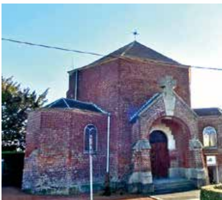
■ Chapelle Notre-Dame de Grâces, Illies.