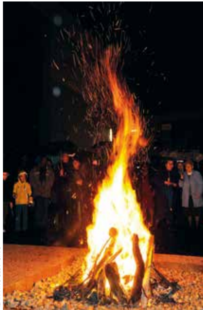
ALAN PINOGES / CIRIC

Cette résurrection n'est pas un mythe. Elle est le fondement de notre foi pour laquelle nous nous engageons tout entier. Par notre baptême et avec le Christ, plongés dans sa mort et dans sa résurrection, nous sommes devenus des hommes nouveaux faisant partie de son peuple. Laissons-nous donc envahir par cette logique de la vie plus forte que toute autre logique. Remplis de cette vie nouvelle, devenons missionnaires de Jésus le Christ ressuscité. N'hésitons pas à aller dans notre monde, nos familles, nos lieux de vie, parfois à contre-courant de ce qui se dit ou ce qui se fait, pour dire ce qui nous fait vivre. Sachons que lorsque nous voulons vivre en compagnie de Jésus ressuscité, il est bien rare que nous fassions l'unanimité autour de nous. Que cette fête de Pâques fasse grandir en nous notre foi, notre espérance et notre charité.