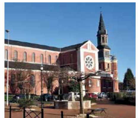
■ Notre-Dame de Grâces, Loos.

On vient quand on peut ! On part quand on veut ! Logistique assurée pour les voitures. Chacun amène son pique-nique.