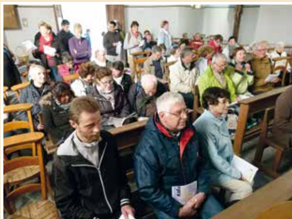
■ Chapelle Notre-Dame de Grâce au hameau de Ligny-le-Grand. Accueil café-temps de prière et lancement de la journée «La miséricorde, c'est le chemin qui unit Dieu et l'homme.»