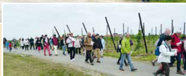
■ En chemin vers Fournes - Temps de méditation et de prière «La miséricorde, c'est la loi fondamentale qui habite le cœur de chacun lorsqu'il jette un regard sincère sur le frère qu'il rencontre sur le chemin.» «La miséricorde est le propre de Dieu dont la toute-puissance consiste justement à faire miséricorde.»