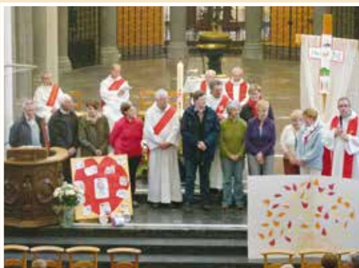
■ Passage de la porte de la miséricorde au début de la célébration à Notre-Dame de Grâce Loos - terme du pèlerinage. «La miséricorde vient de plus profond que nous, de plus fort que nous. Elle est un feu qui peut être inattendu, discret.» Chrétien, quitte ta peur, remets à Dieu tes soucis. Aie confiance en lui car il est ressuscité, vivant à jamais. Heureux les cœurs miséricordieux.