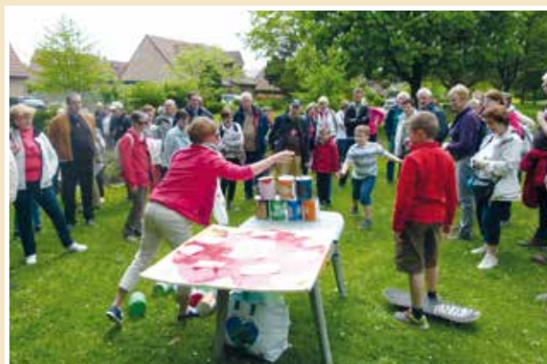
■ Le chamboule-tout «anti miséricorde» «La miséricorde, c'est le chemin qui unit Dieu et l'homme, pour qu'il ouvre son cœur à l'espérance d'être aimé pour toujours malgré les limites de notre péché.»